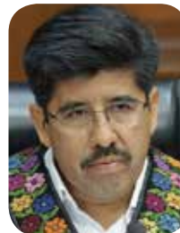
Hugo Aguilar Ortiz